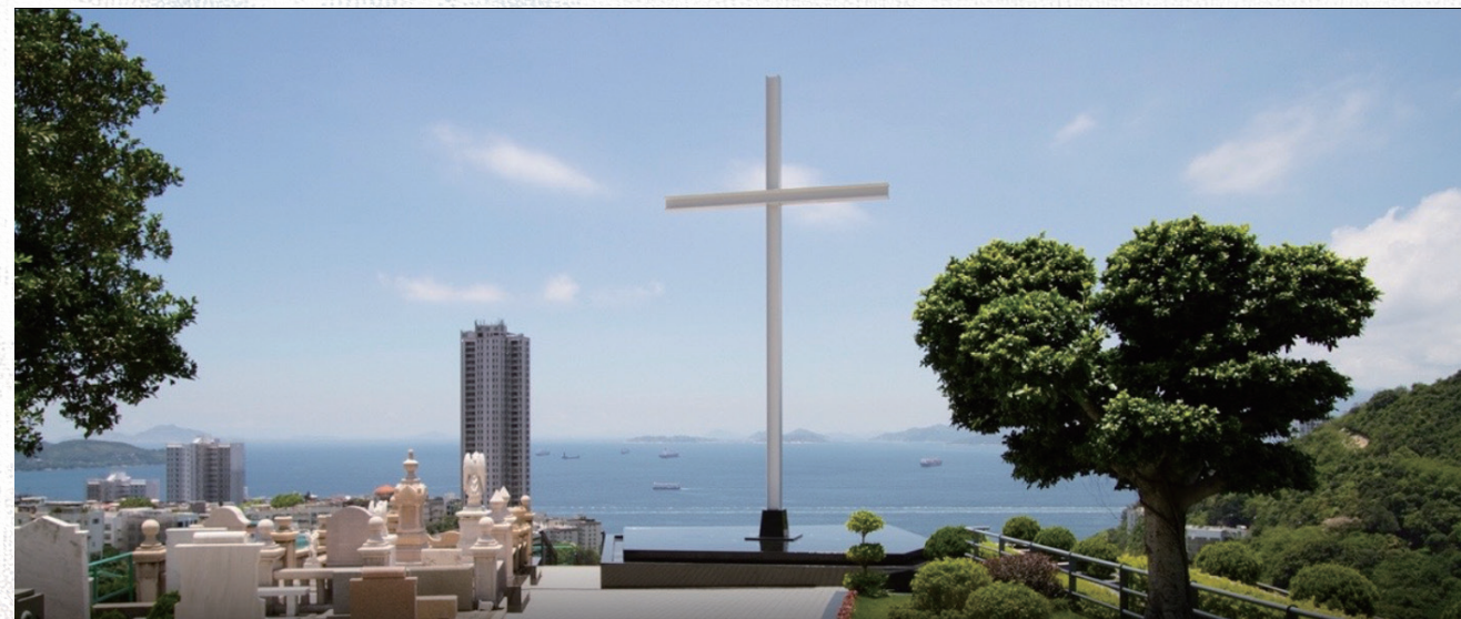
薄扶林華人基督教墳場