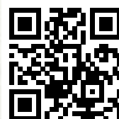
「愛自己·送別無力感」短片