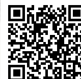
「盼望猶存」短片系列